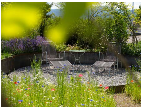
Gartengestaltung mit oder ohne Wasserelement: Ganz wie Sie wünschen.

Sie haben möglicherweise die eine oder andere Idee für Ihren Garten, wissen jedoch nicht so genau, ob und wie diese umsetzbar ist. Beziehungsweise wie daraus ein einmaliges Bijoux werden könnte, in welchem Sie und Ihre Familie sich rundum wohlfühlen werden. Mit bester Empfehlung: Ihre Heggli Gartenprofis.